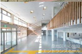
小山町 桑地区中心施設 エントランスホール