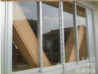
足利市 市立安曇台中学校 耐震補強