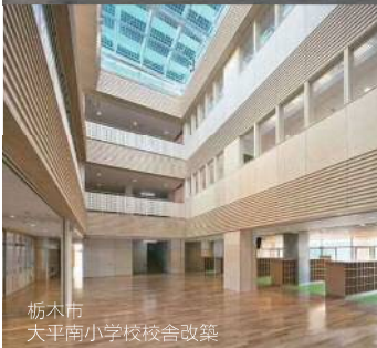
栃木市 太平南小学校校舎改築