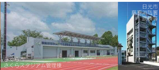
さくら市 さくらスタジアム管理棟