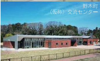
野木町 (仮称) 交流センター