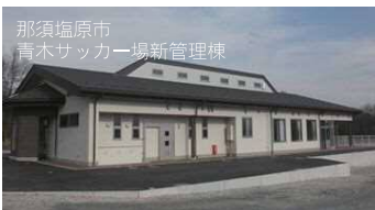
那須塩原市 青木サッカー場新管理棟