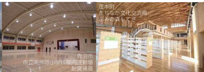
茂木町 まちなか文化交流館 ふみの森もてぎ