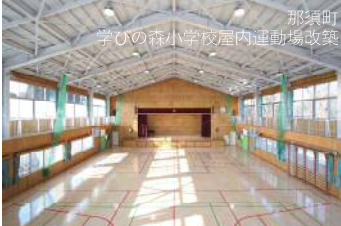
茂木町 学ひの森小学校校屋内運動場改築