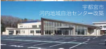
宇都宮市 河内地域自治センター改築