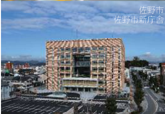
佐野市 佐野市新庁舎