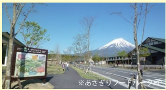
あさぎりフードパーク

道の駅は、休息・情報交流・地域連携という3つの機能を併せ持つ休息施設です。施設内には、レストラン、土産物売店、アイスクリーム工房、売店には新鮮野菜売場を併設しています。 【営業時間】売店・アイス工房:8:00~18:00 食堂(レストラン):8:00~17:30