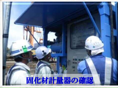
固化材計量器の確認