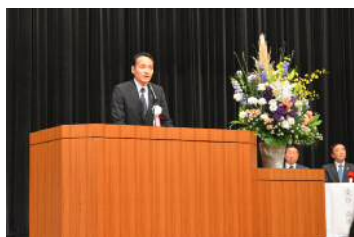
挨拶 築国土交通大臣政務官