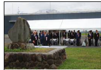
出席者全員による黙禱