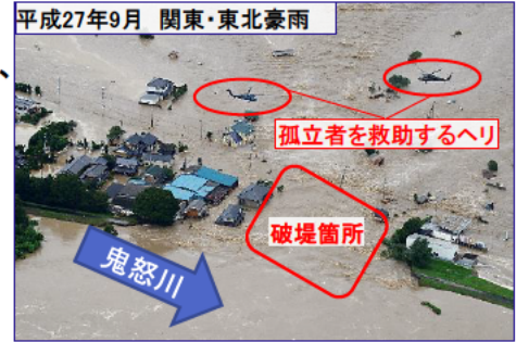
平成27年9月 関東・東北豪雨