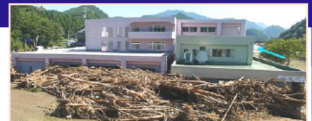
平成28年台風10号により、岩手県の要配慮者利用施設では利用者9名の全員が死亡。