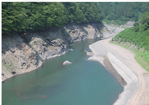
荒川上流の二瀬ダム(7月21日撮影)。 今夏、貯水量が平年に比べて1ヶ月以上も早いペースで少なくなった。