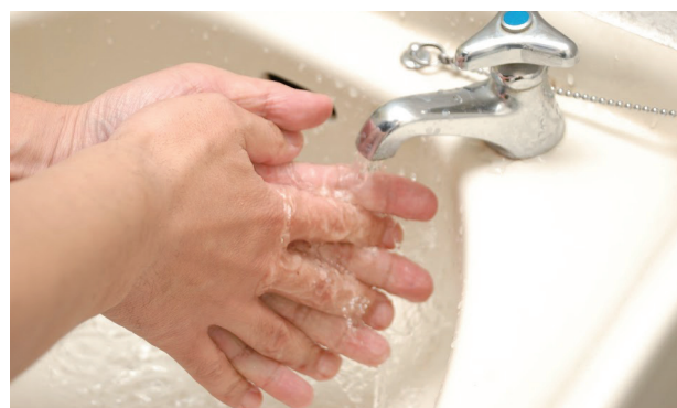
荒川の水を利用するみんなの1日50リットルの節水は、彩湖の水深70cm分にもなるんだって

水は、ダムの運用などで安定的に確保された限りある「資源」。常に節水を心がけよう。