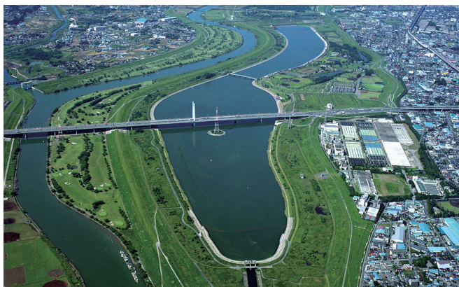
彩湖周辺は貴重な水辺空間として人気。実は、治水や利水の役割を果たし、暮らしを守っているんだね

併設された浄化施設は、下水処理水をさらに浄化して荒川へ放流して、その量と同じだけの河川水を飲み水として取水する仕組みにしているんだ。家庭からの雑排水も役立っているんだね。彩湖のはたらきは「彩湖自然学習センター」で学べるよ(無料)。