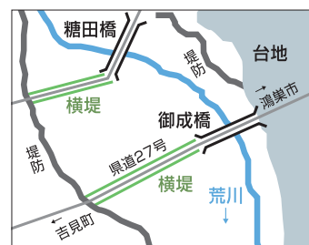
県道27号に架かる御成橋を渡ると、右岸側の道路が「横堤」の上を走っていることに気づく。

糖田橋付近から笹目橋付近までの区間に、堤防から直角に川の方へ張り出した堤防「横堤(よこてい)」があります。洪水の勢いを弱めて遊水効果を高めるもので、昭和初期に27本が築られました。例えば「川幅日本二」の標柱が立つ御成橋。日本一長い橋かと思いきや、実は横堤の上を道路が走っています。