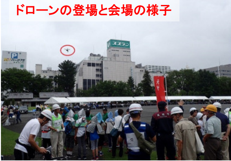
ドローンの登場と会場の様子