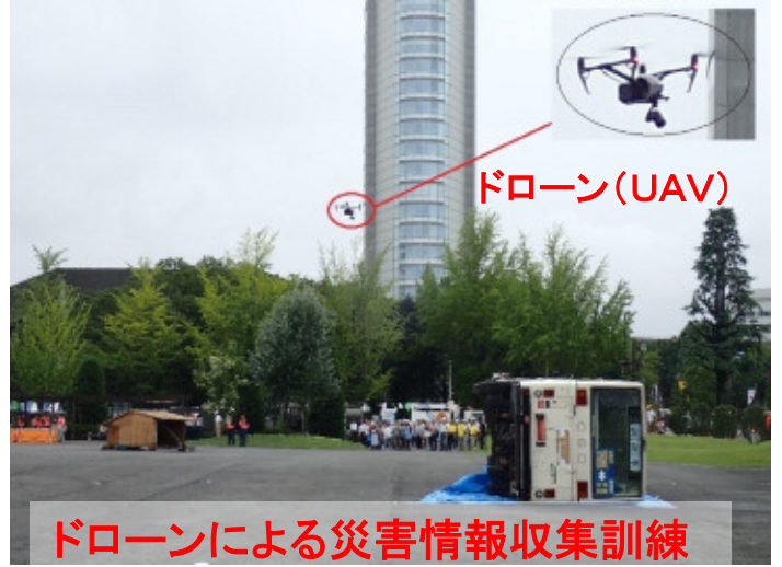
ドローンによる災害情報収集訓練

利根川水系砂防事務所は、平成29年8月20日(日)に実施された高崎市総合防災訓練へ参加し、「ドローン」を活用した被害調査を行う災害情報収集訓練を実施しました。また、今年はカスリーン台風より70年目を迎える事から、当時の被災や今年7月の九州北部豪雨でのテックフォースの活動等のパネル、災害時のドローンの役割などの展示を行いました。