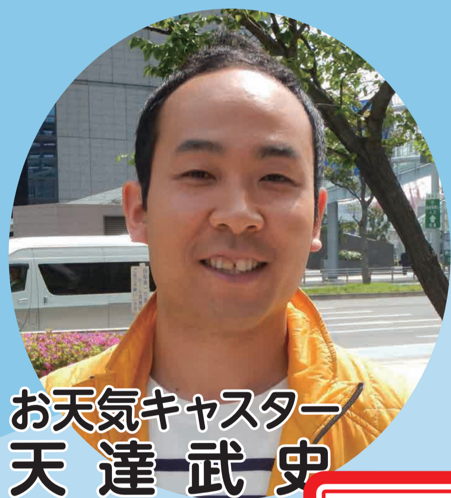
お天気キャスター 天達 武史