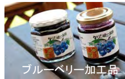
ブルーベリー加工品