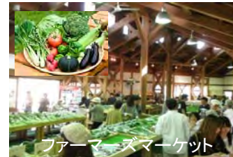
ファーマーズマーケット