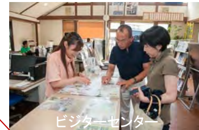
ビジターセンター