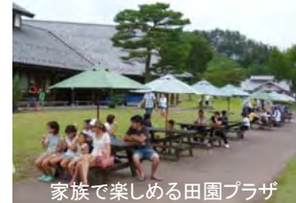
家族で楽しめる田園プラザ