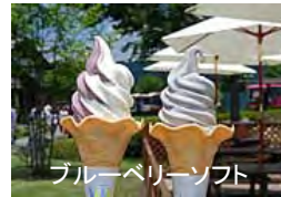
ブルーベリーソフト

・園内では朝取り野菜・ブルーベリーや乳製品などの地域資源を活かし、果物狩りや陶芸などの体験やイベント等により、村民と来訪者の交流の機会を提供。