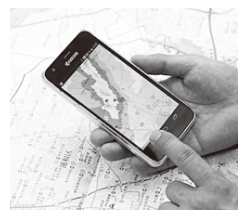
早速、スマホで「川の防災情報」サイトを試した。操作は簡単、雨量の変化や川の水位がひと目で分かるよ

国土交通省はインターネットで「川の防災情報」を発信している。雨の状況や川の水位などを知れば、避難を判断するのに役立つね。スマホのGPS機能を使って、現在地周辺のレーダ雨量や、川の水位などがいち早く入手できる。また、荒川水系では携帯電話の「緊急速報メール」を活用して、洪水情報の配信も始まった。的確な判断と防災行動に生かそう!