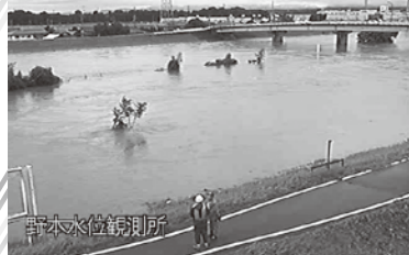
2015年9月の関東・東北豪雨の影響で、都幾川が氾濫危険水位に(東松山市野本地区)