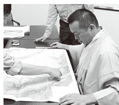
避難場所までのルートは水に浸かっているかもしれない。子どもたちと一緒に確認しておかなくちゃ

「洪水ハザードマップ」を知ってますか。川のはん濫などで浸水が想定される範囲と深さ、避難場所などが記載されている地図。市町村が作成して配布しているから、お宅にもあるはず。万一のときに取り出すのでは間に合わない。