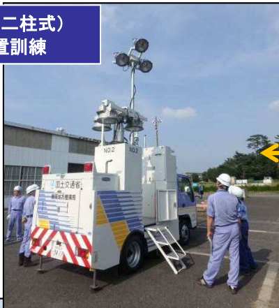
照明車(二柱式) の設置訓練