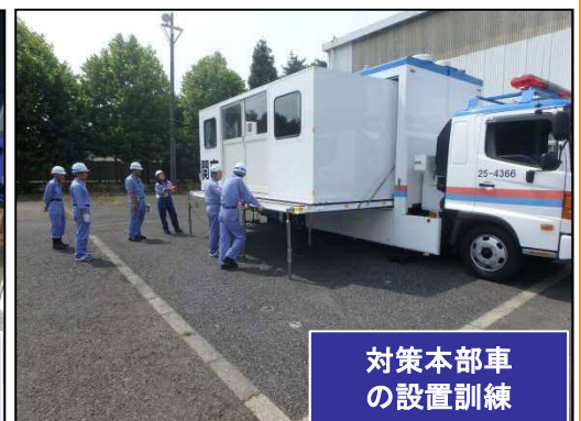
対策本部車 の設置訓練