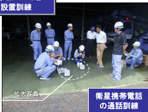
衛星携帯電話 の通話訓練