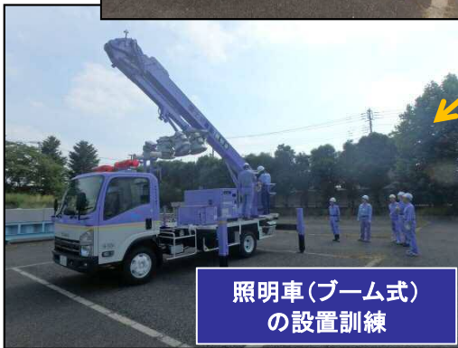
照明車(ブーム式) の設置訓練