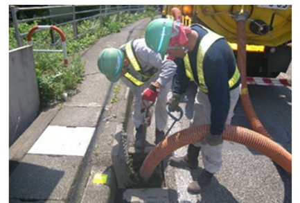
④ 道路排水柵の清掃