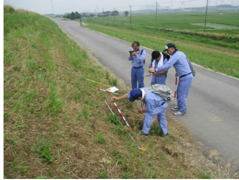
江戸川左岸33.2k付近、堤防に小規模な崩れ (要監視)

5/31, 6/5, 6/9の3日間 松戸管内で徒歩による 出水期前の堤防点検を 実施しました。要監視 箇所を含めた、堤防の 変状を把握し、対策が 必要な箇所は計画的に 補修、次回(台風期)の 点検時まで、補修を 完了させる予定です。