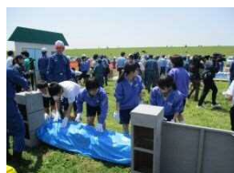
住民による訓練 （自衛水防活動）