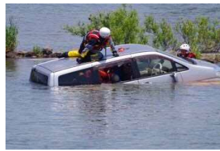
高度救助隊による 水没車両からの救助訓練