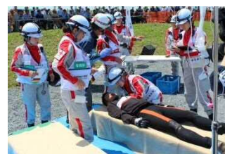
日本赤十字社による 応急救護訓練