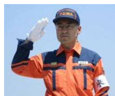
杉本国民保護・ 防災部長による挨拶