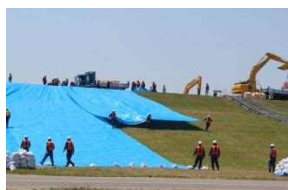
水防団による訓練 （裏シート張り工）