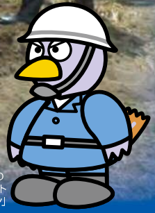
埼玉県の マスコット 「コバトン」

アンケートのご協力・ 体験コーナー参加の方には 「記念品」進呈! 記念品協力 株式会社湖池屋、株式会社コロンバン ※数に限りがあります。