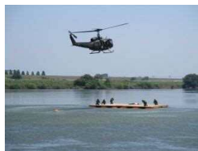
陸上自衛隊による 孤立者救助訓練