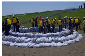
水防団による訓練 （釜段工）