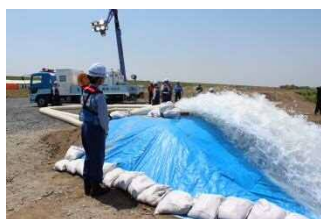
排水ポンプ車による 緊急排水活動