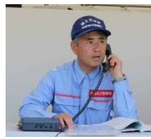
事務所長と加須市長による訓練 （ホットライン）