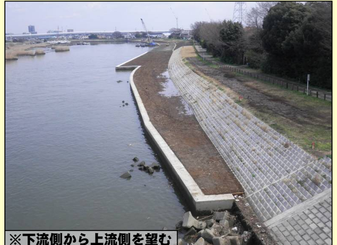
※下流側から上流側を望む

※堤防整備が行えるよう、既設の護岸より川側に新たな低水護岸（平場）を新設し河川敷の幅を広げる工事を行いました。