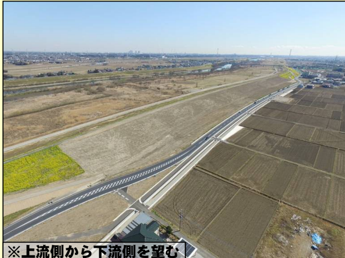
※上流側から下流側を望む

※堤防強化対策として、平成27年度に完成した県道と水路の付け替え工事に続く本格的な堤防の拡幅工事（第一期盛土工事）を行いました。