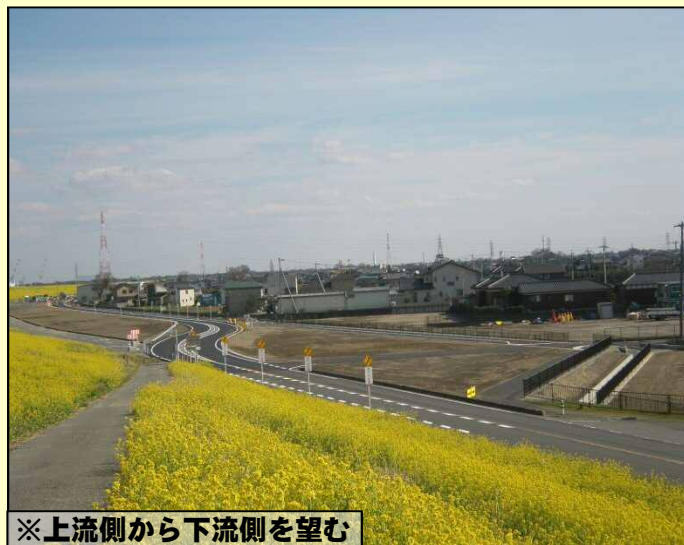
※上流側から下流側を望む