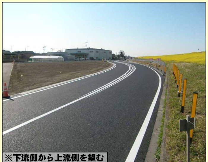
※下流側から上流側を望む

※江戸川右岸(埼玉県吉川市)の堤防断面を拡幅するにあたり、堤防沿いの県道(主要地方道三郷松伏線)と並行する葛西用水路に影響してしまうため、この県道と用水路を付け替える(移設する)工事を行いました。