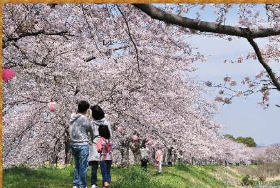
最優秀賞(第3回作品)