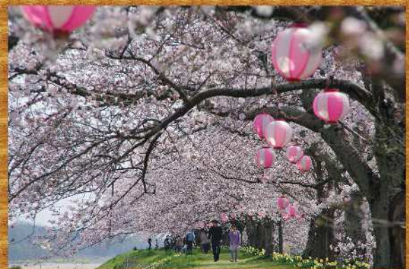
金崎のさくら賞(第3回作品)