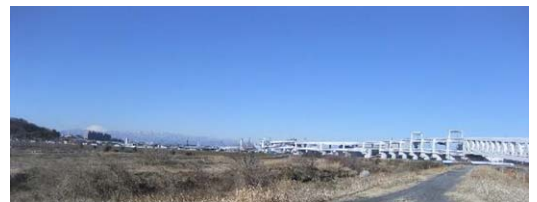
亀の甲橋からの横浜北線と富士山・丹沢山塊

本日(2月11日)鶴見川護岸を巡回してきました。非常に晴天で、多くの皆さんが護岸上をウォーキング・サイクリング等のスポーツを楽しんでいました。 1、気になったこと (1)上末吉地区護岸改良工事について (2)末吉橋下流水道管橋撤去工事(川崎市) ・ブイの表示・護岸側の安全施設・工事看板等について ご報告頂きました。 【ご報告頂いた件現地確認を行いました】