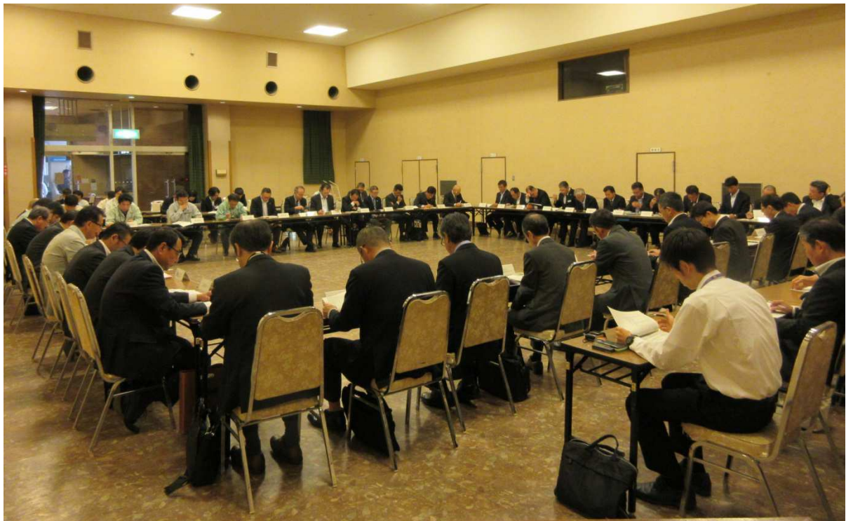
第8回群馬県メンテナンス協議会の実施状況 (平成28年10月25日)