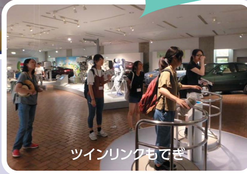
ツインリンクもてぎ