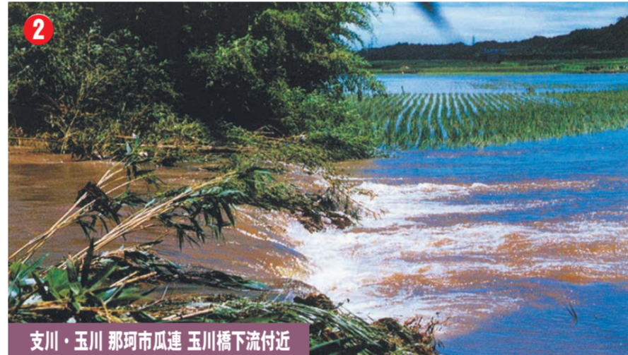
支川・玉川 那珂市瓜連 玉川橋下流付近