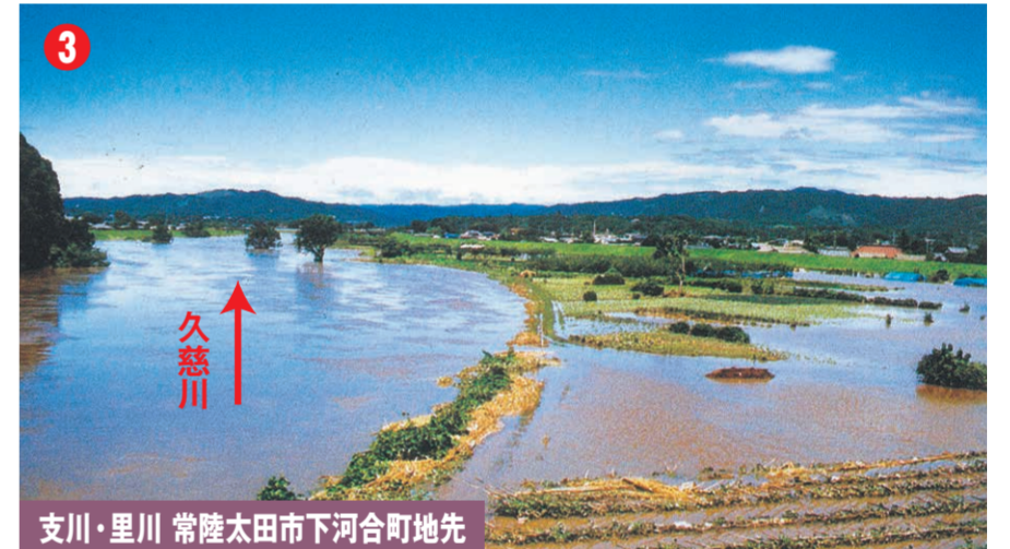
支川・里川 常陸太田市下河合町地先