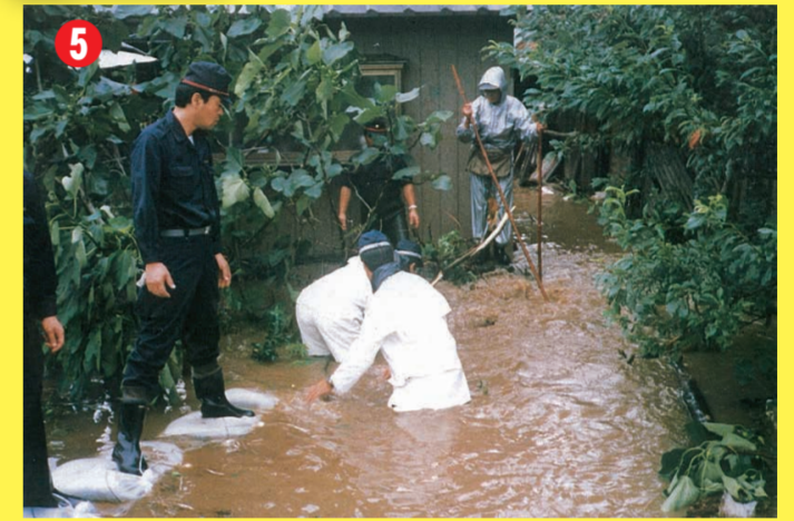
日立市下土木内町地先