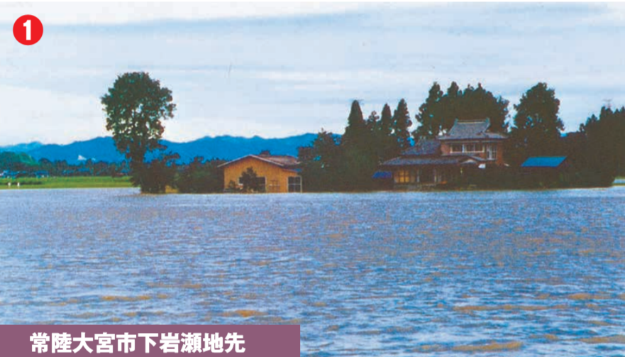
常陸大宮市下岩瀬地先