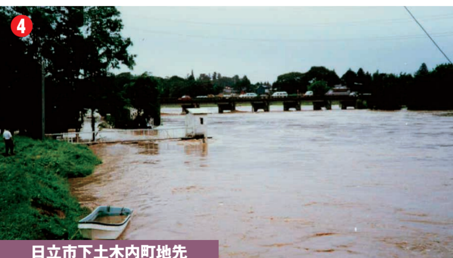
日立市下土木内町地先