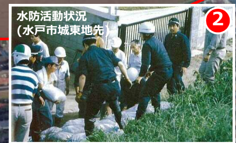
平成28年3月末時点の堤防位置