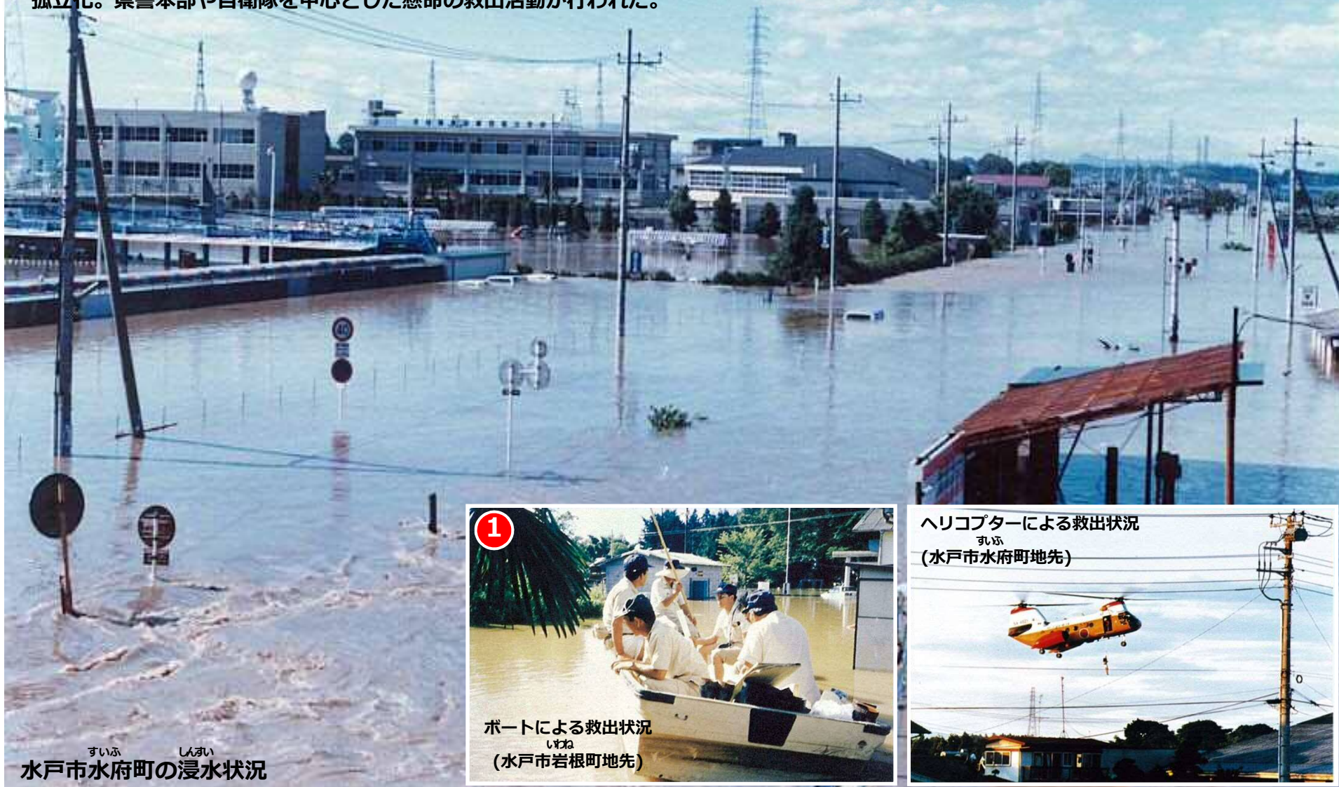
すいふ しんがい 水戸市水府町の浸水状況

一面泥の海と化した水戸市の市街地などでは、逃げ遅れた住民が孤立化。県警本部や自衛隊を中心とした懸命の救出活動が行われた。