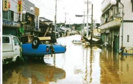
逆川_茂木町茂木地先