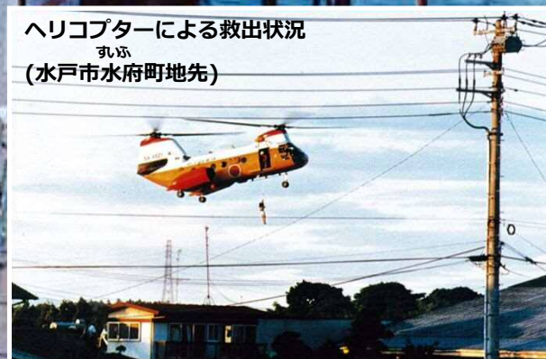
ヘリコプターによる救出状況 すいふ (水戸市水府町地先)