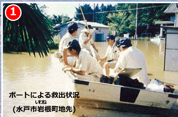
1 ボートによる救出状況 いね (水戸市岩根町地先)