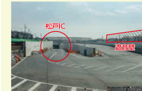
松戸IC: 国道298号から高速道路(高谷JCT方面)への入り口です。