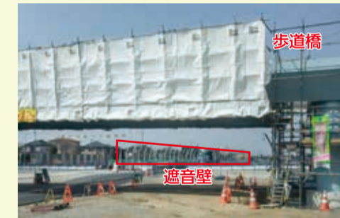
遮音壁は、一般的な不透光タイプを採用しますが、交差点などで見通しが必要な場所には、不透光タイプと透光タイプを組み合わせたものを採用します。