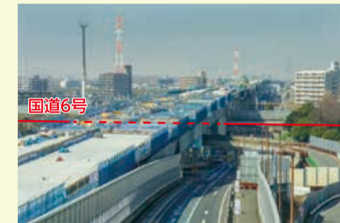
国道6号を越える高速道路の高架橋