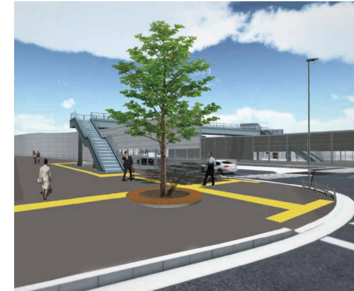
交差点部イメージ