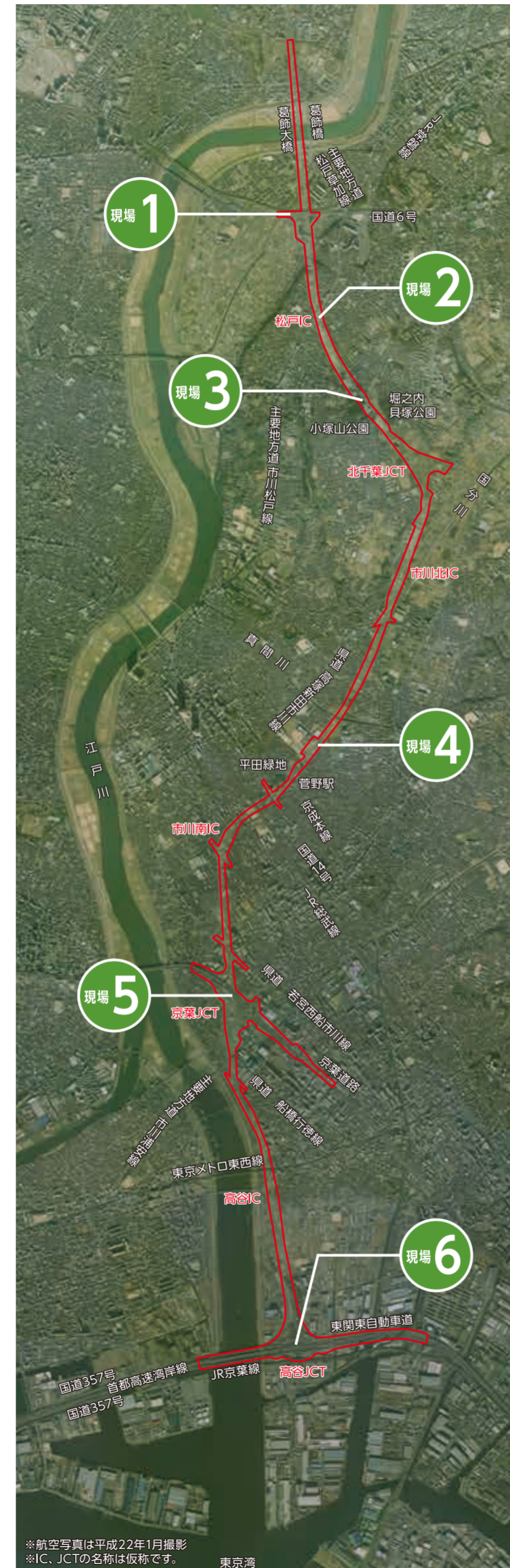
*航空写真は平成22年1月撮影 *IC、JCTの名称は仮称です。