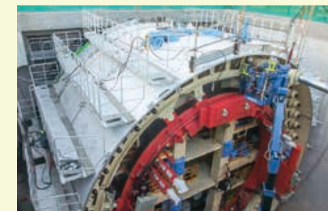
地下掘削を行うシールドマシン