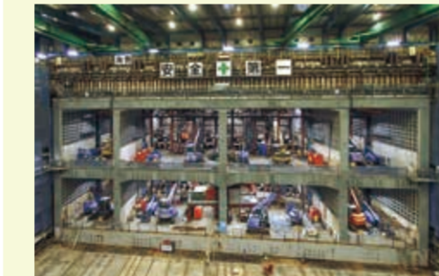
京成本線交差点部(平成27年7月撮影)