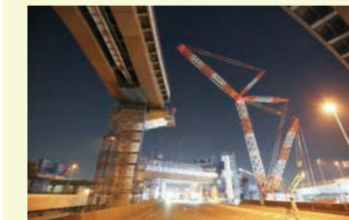
通行への影響を考慮し、架設工事は夜間に行っています。