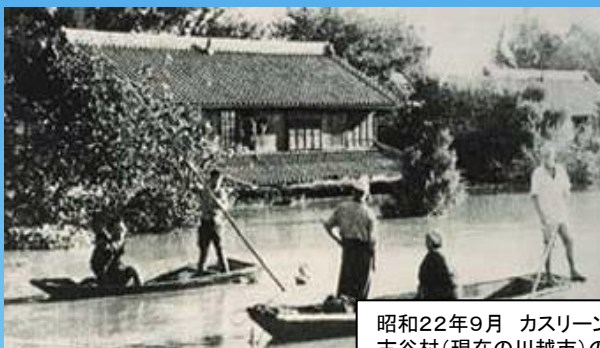
昭和22年9月 カスリーン台風 古谷村(現在の川越市)の浸水状況