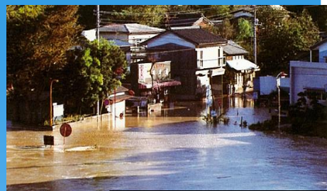
昭和57年9月 台風18号 上尾市開平橋付近の浸水状況