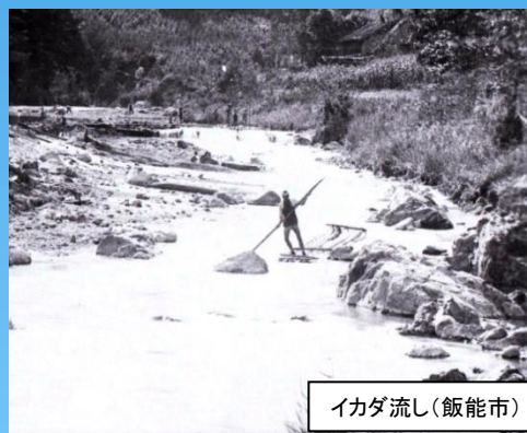
イカダ流し(飯能市)