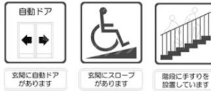
荒川上流河川事務所