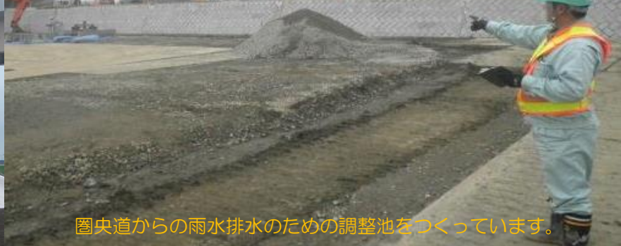
圏央道からの雨水排水のための調整池をつくっています。