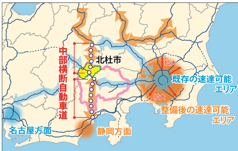
【中部横断自動車道による速達可能エリアの拡大イメージ】

【地元の声】 農産物の輸送には、大量かつ迅速、そして何より新鮮さが要求されます。中部横断自動車道が静岡県から長野県まで全線開通することで、商圏エリアは、関東や関西方面に加え、北関東や東北まで拡大できると考えています。