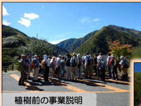
植樹前の事業説明

わ鉄のツアーと、体験植樹が連携したのは初めての事です。国が行っている砂防事業を知って頂くいい機会になったと考えています。また、体験植樹とツアーの連携が足尾地区を盛り上げるきっかけになれば幸いです。