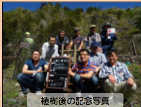
植樹後の記念写真