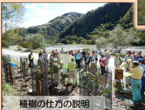
植樹の仕方の説明