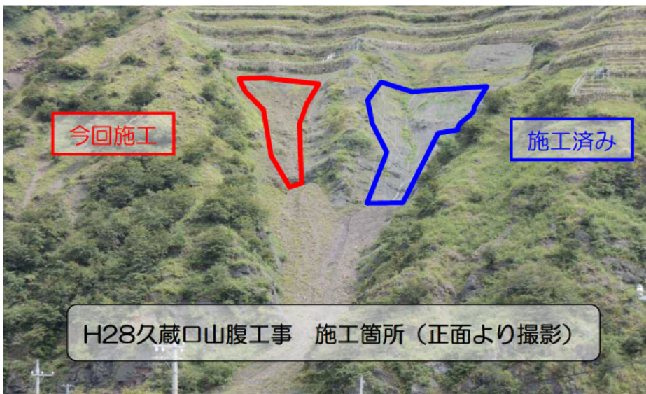
H28久蔵口山腹工事 施工箇所（正面より撮影）

中村土建株式会社と契約を締結し、平成28年9月7日より工事を開始しました。 この工事は、平成27年の台風によって土砂流出のあった沢に落石防護ネットを張ることで、崩壊を食い止める工事です。写真右側（青色囲い）は今年の6月に完成し、残った左側の沢（赤色囲い）を来年の3月までの予定で施工します。