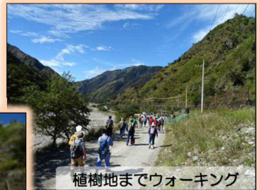
植樹地までウォーキング