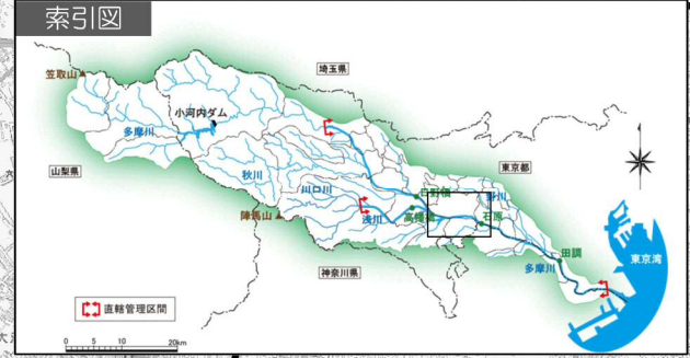
多摩川水系多摩川、浅川、大栗川洪水浸水想定区域図（家屋倒壊等氾濫想定区域（氾濫流））