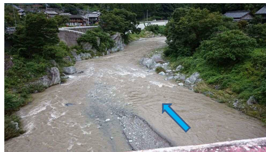
柏木橋より下流を望む