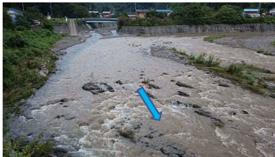
野栗沢合流点付近