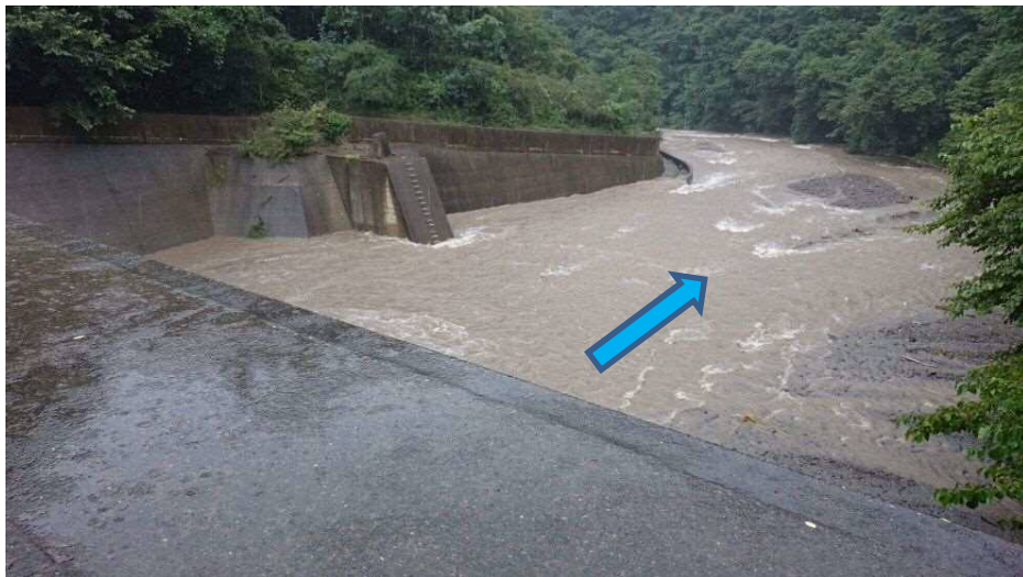
乙母(おとも)砂防堰堤より下流を望む