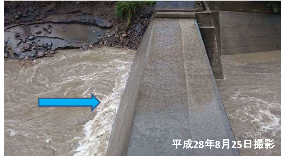
乙母砂防堰堤右岸天端から上流を望む