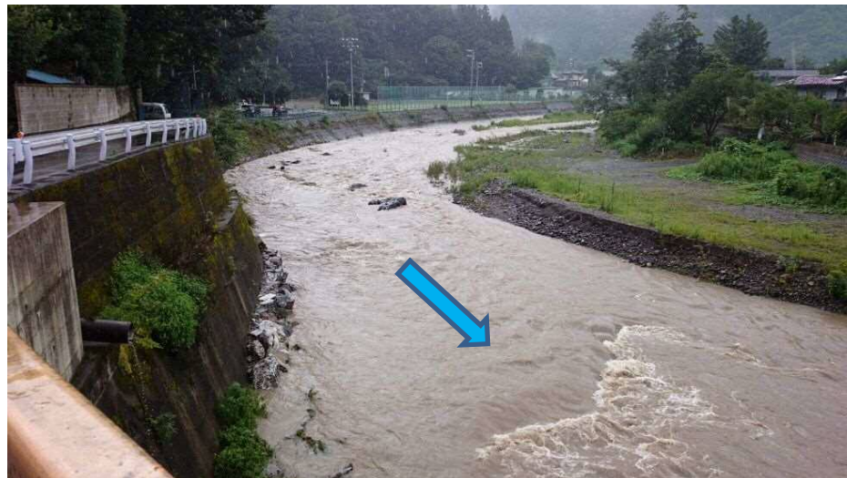
上野村役場付近 興和橋より上流を望む