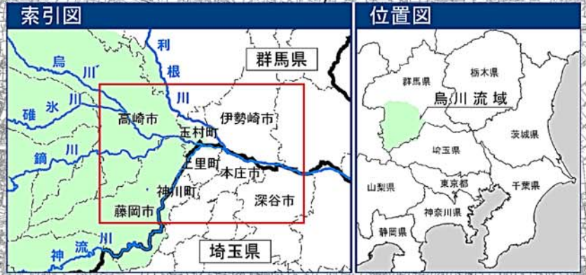
利根川水系烏川・神流川・鎗川・碓氷川洪水浸水想定区域図 (家屋倒壊等氾濫想定区域(河岸侵食))

1 説明文 (1) この図は、利根川水系烏川・神流川・鎗川・碓氷川の洪水予報区間について、家屋倒壊等をもたらすような氾濫の発生が想定される区域(家屋倒壊等氾濫想定区域)を表示した図面です。 (2) この家屋倒壊等氾濫想定区域は、現時点の烏川・神流川・鎗川・碓氷川の河道及び洪水調節施設の整備状況を勘案して、想定最大規模降雨に伴う洪水により烏川・神流川・鎗川・碓氷川の河岸の侵食幅を予測したものです。 (3) また、家屋倒壊等氾濫想定区域(河岸侵食)は、烏川・神流川・鎗川・碓氷川の河岸が侵食された場合における、家屋の倒壊・流出等の危険性がある区域の目安を示すものですが、個々の家屋の構造・強度特性等の違いから、この区域の境界は厳密ではなく、あくまでも目安であることを留意して下さい。