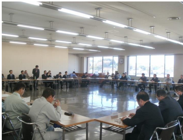
会議開催状況 (参加人数 約50名)