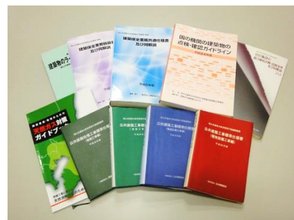
各基準類や資料等などの情報提供により様々な疑問を解決します。

手続き資料の提供や、総合評価における資格要件の考え方、情報公開などへの対応について説明し、解決へ至りました。