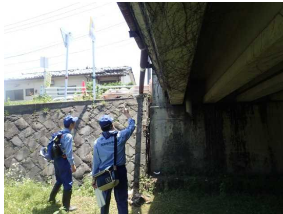
ましきまち 【橋梁被災状況調査(益城町内)】