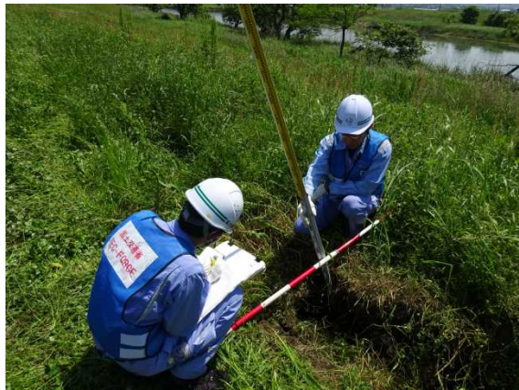
かしまち かせがわ 【被災箇所状況調査(嘉島町 加勢川)】