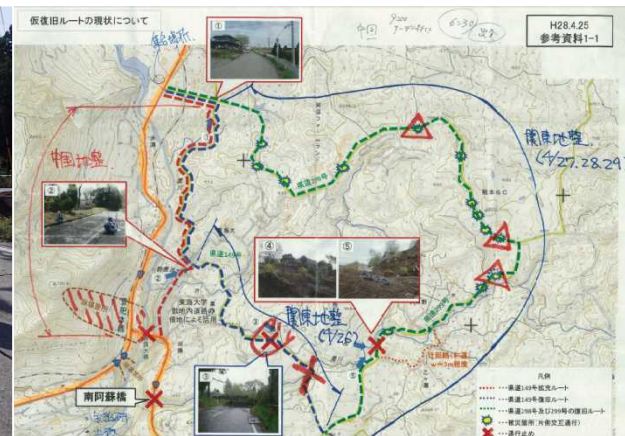
みなみあそむら 【県道149号、299号の被災状況調査から国道57号迂回路を検討(南阿蘇村)】