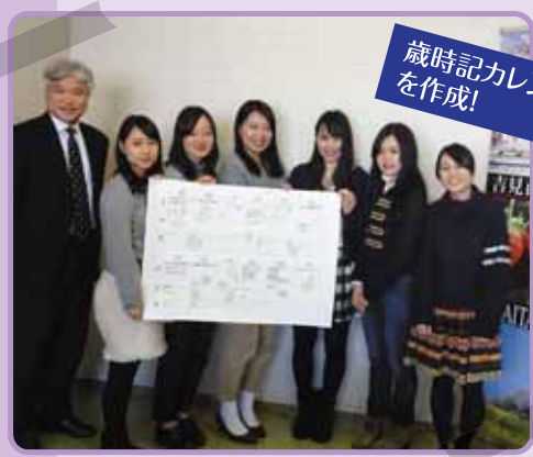
歳時記カレンダー を作成!