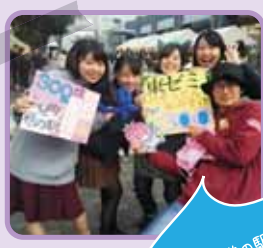
学園祭で道の駅をPR!