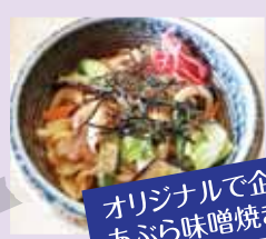
オリジナルで企画した あぶら味噌焼きうどんを販売