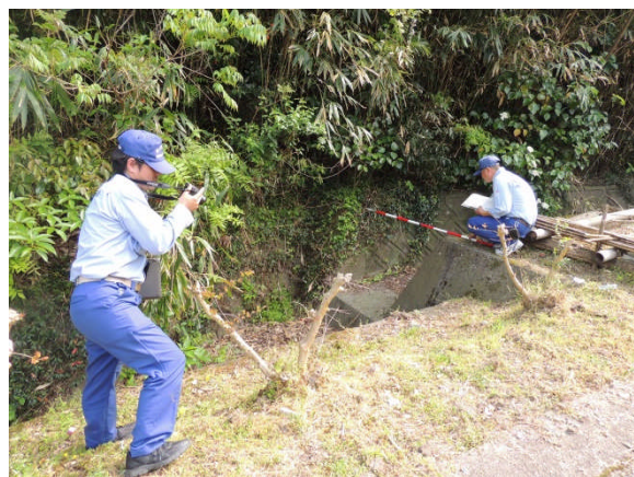
③14時頃 土石流被災状況調査