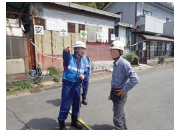
地元区長さんに聞き取り