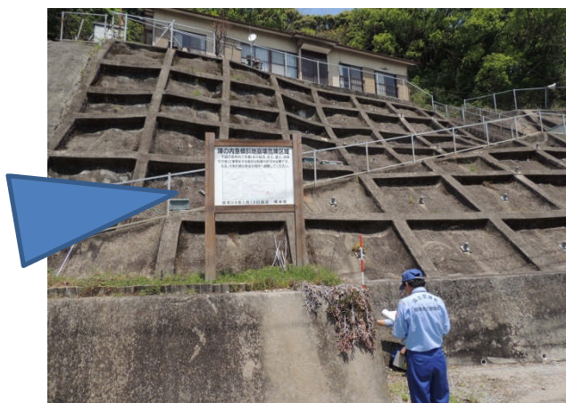
①12時頃 急傾斜地被災状況調査