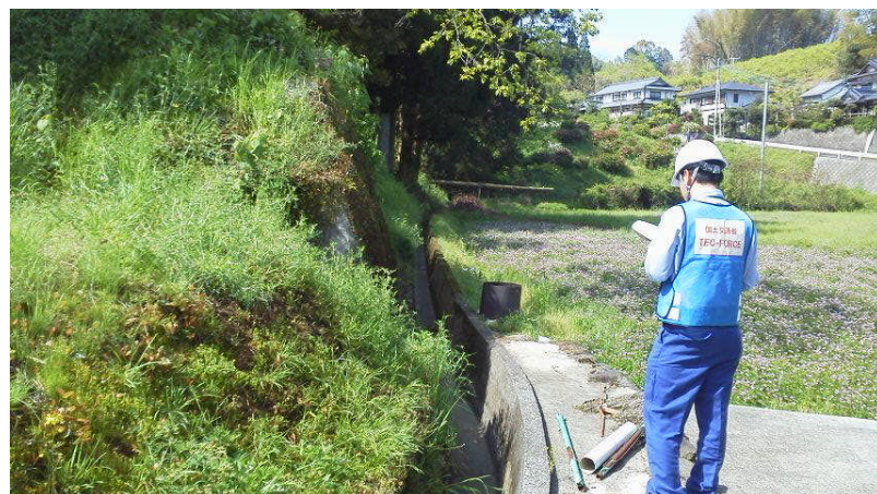
③12時頃 土石流被災状況調査