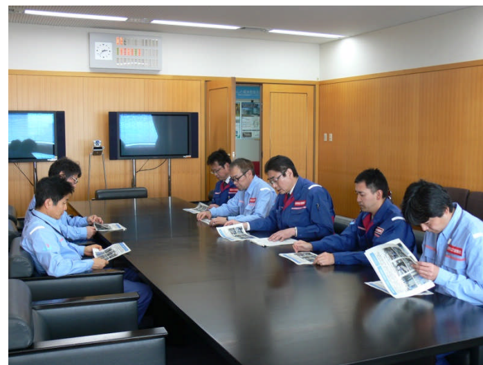
<14時30分頃 本部(隊員5名)>