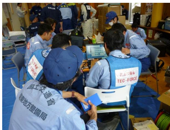
益城町保健福祉センター14時頃 調査結果とりまとめ