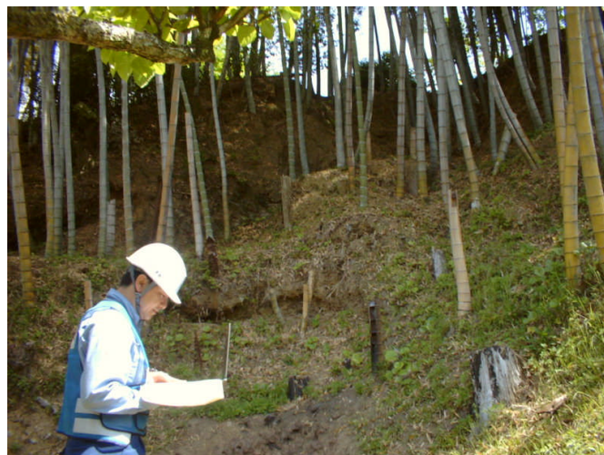
①急傾斜地被災状況調査

うきし 宇城市内の急傾斜地や土石流の危険箇所について、現地状況調査を行い、安全の確認を行いました。