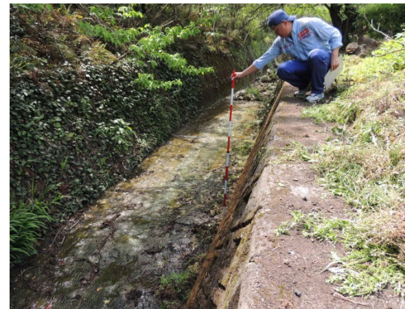
④14時頃 土石流被災状況調査