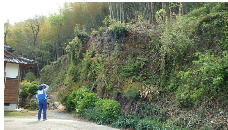
②15時頃 急傾斜地被災状況調査