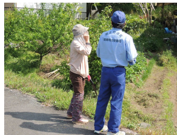
<現地住民への聞き取り調査>