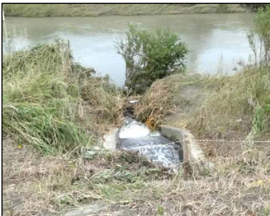
○旧水路からの流出状況 (9. 14)