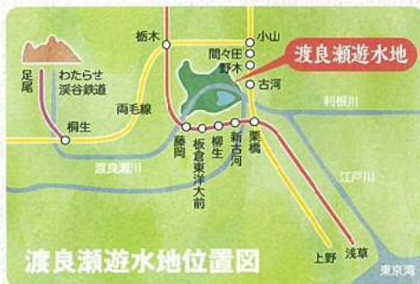
渡良瀬遊水地位置図

バスの方 栃木市ふれあいバス（藤岡線）「藤岡総合体育館」、「谷中湖（土日祝日のみ運行）」、「道の駅きたかわべ（平日のみ運行）」下車／ 栃木駅南口から1時間20分、藤岡駅から10分／本数が少ないため出発前に確認を（問い合わせ先：株式会社ティ・エイチ・エス ☎0282-61-2301）