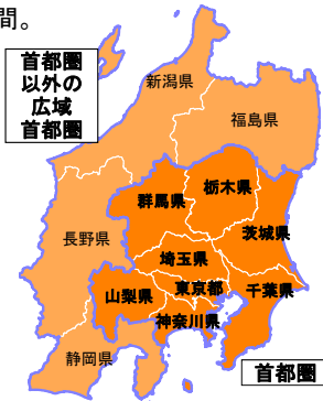
図 広域首都圏の範囲 (うち濃橙色部分が首都圏)