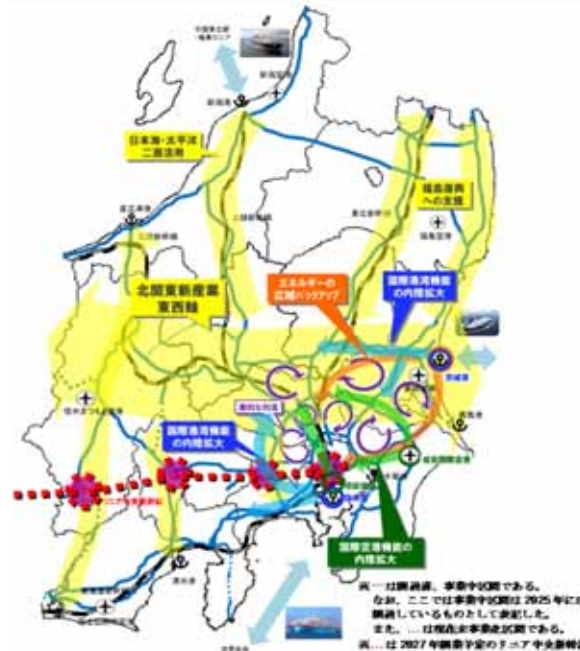
図「対流型首都圏」の構築イメージ