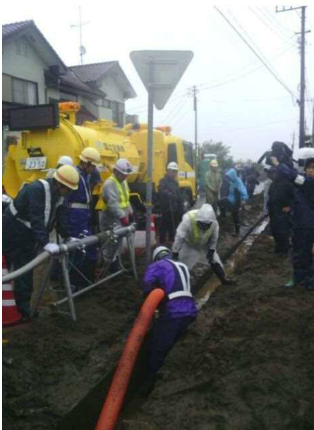
側溝清掃車(バキューム付)による 堆積土の撤去