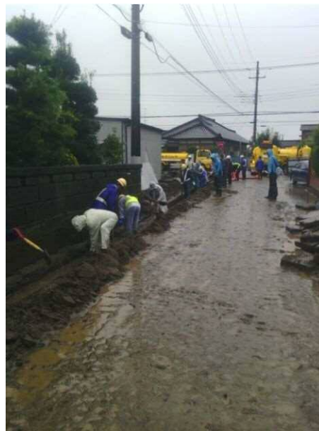
人力による堆積土の撤去