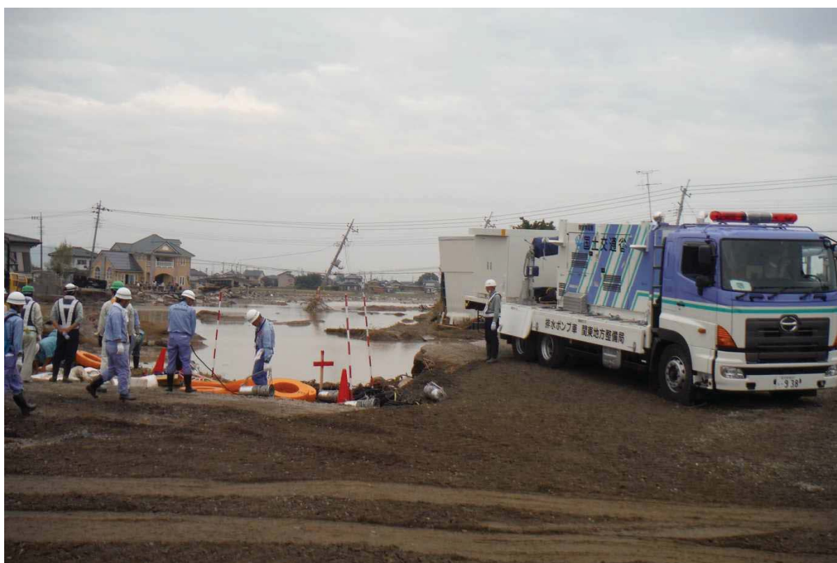
排水ポンプ車による工事現場内の排水