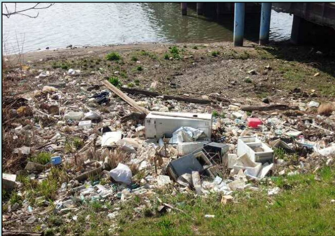
※川岸に捨てられたゴミ類（不法投棄）