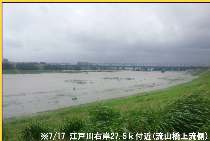
※7/17 江戸川右岸27.5k付近(流山橋上流側)