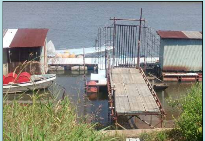
※不法係留施設及び不法係留船