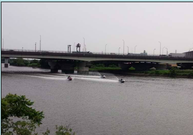
※川面上を走行する複数台の水上バイク