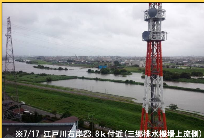
※7/17 江戸川右岸23.8k付近(三郷排水機场上流側)

大雨の後、すぐに川に近寄るような行為はくれぐれもお止めください。河川敷がぬかるんでいたり、突然水位が上昇したりする場合がありますので、水位がちゃんと下がり、また河川敷への進入も問題ないことが確認出来てから近寄るようにしてください。