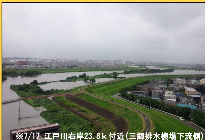
※7/17 江戸川右岸23.8k付近(三郷排水機場下流側)