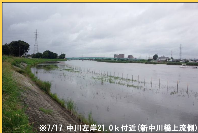
※7/17 中川左岸21.0k付近(新中川橋上流側)