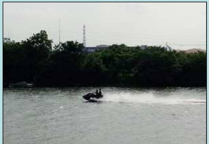
※川面上を駆け抜ける水上バイク

江戸川河川事務所としましては、これまでも河川管理の一環として、ゴミの不法投棄防止に向けた取り組みや、不法係留施設及び不法係留船への是正措置などを行ってきました。しかし、現状においてもマナー違反行為が見受けられます。