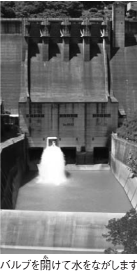
バルブを開けて水をながします