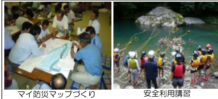
マイ防災マップづくり