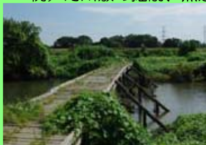
ピオトープの整備