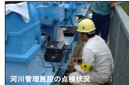
河川管理施設の点検状況