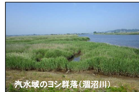
汽水域のヨシ群落(涸沼川)