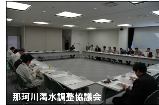
那珂川渇水調整協議会