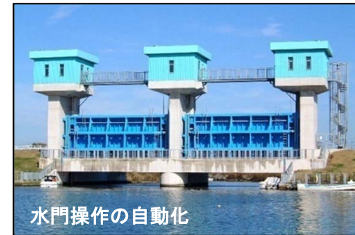
水門操作の自動化