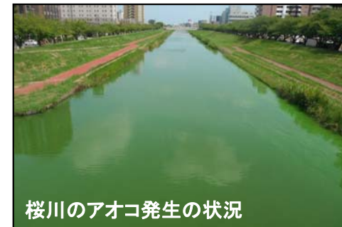
桜川のアオコ発生の状況