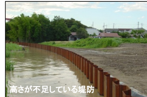
高さが不足している堤防