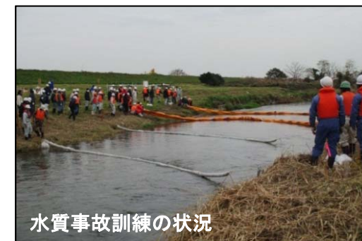
水質事故訓練の状況