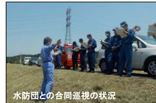
水防団との合同巡視の状況