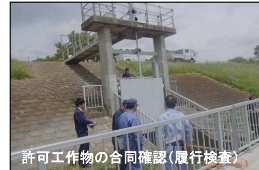
許可工作物の合同確認(履行検査)