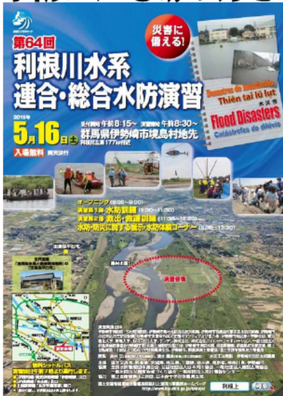
図-1 演習パンフレット