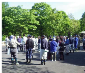
写真-4 昨年のクリーン運動参加状況 (小平地区)=平成26年5月11日

渡良瀬川クリーン運動！5月10日、日曜 みんなの川を、みんなの手で、キレイに！ ボランティアや除草などの清掃活動により、良好な自然環境に戻りつつある渡良瀬川とその支川ですが、未だポイ捨ては後を絶ちません。このような現状を住民の皆様にも広く知っていただく、綺麗で安全な水辺を保つために、平成7年から毎年1回、この清掃活動を実施しています。 今年も多くの皆様のご参加を心よりお待ちしております。