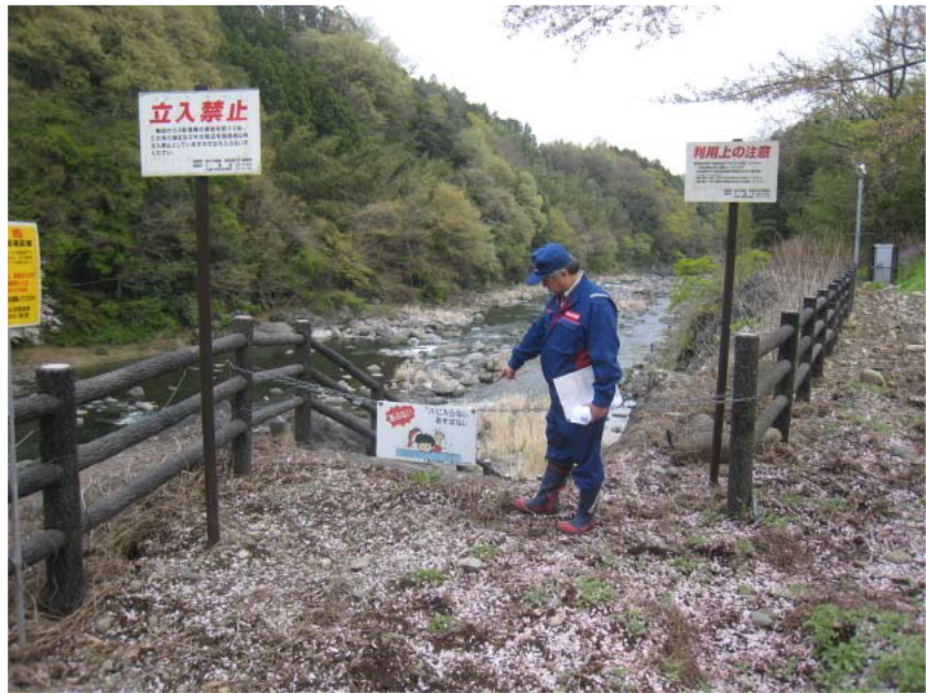
写真-1 安全利用点検実施状況（上神梅護岸にて）=4月17日