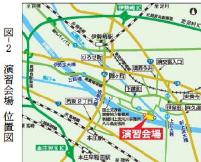
図-2 演習会場位置図

今回の演習会場へのアクセスについては、周辺ルートを一覧としますので、ご来場される方は、事前に、国土交通省利根川上流河川事務所のHP等でルートをご確認いただくとスムーズかと思えます。（「利根上」で検索）