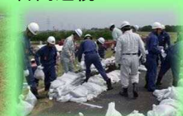
筑西市消防団 水防訓練