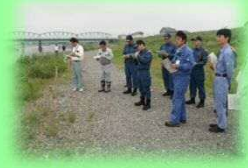
重要水防箇所 合同巡視