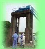
許可工作物 履行検査