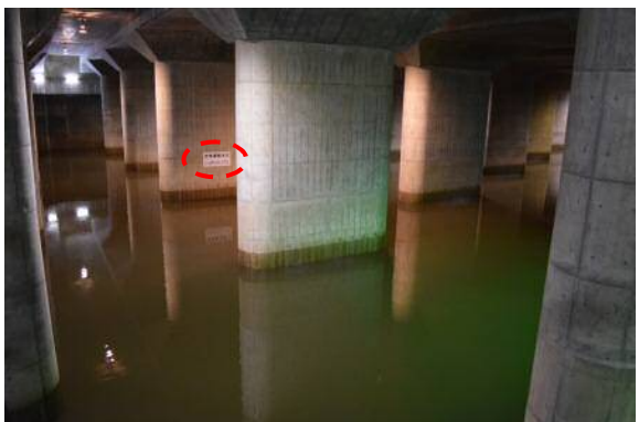
台風18号における調圧水槽（地下神殿）内への流入状況です。