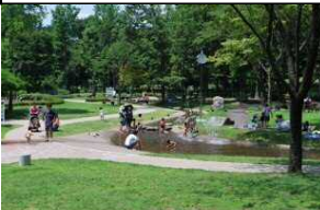
城山公園(約10.3ha) 約1.4haの多目的広場や市民の憩いの場