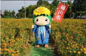
べに花によるまち興し べに花畑とオケちゃん