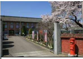
世界遺産との連携