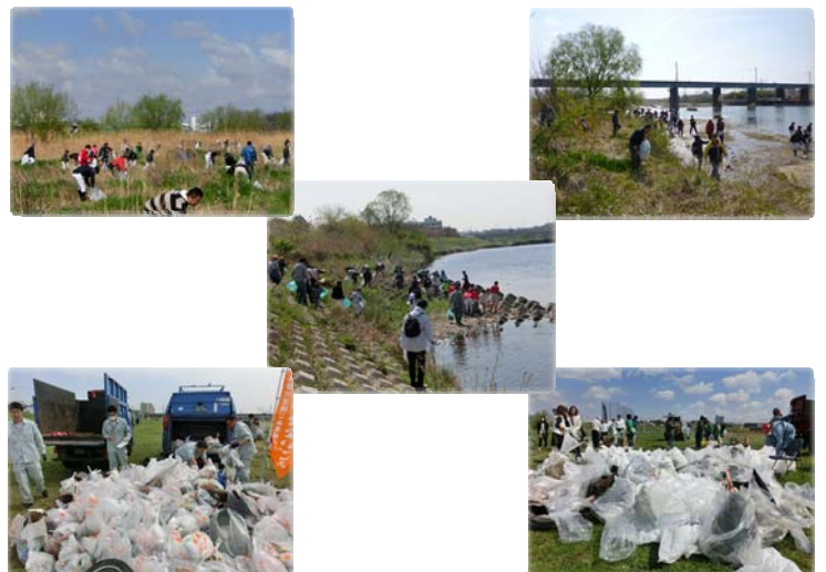
自治会、子ども会、少年野球チーム、企業などから沢山の皆様に参加されました。

※各地の開催要領は各自治体で計画していますので、お問い合わせは各自治体をお願いします。