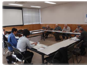
多摩川中流分科会