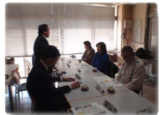
多摩川下流分科会