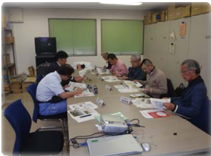
鶴見川上下流合同分科会