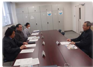
多摩川上流分科会