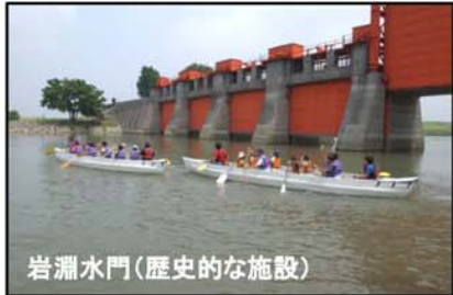
岩淵水門(歴史的な施設)