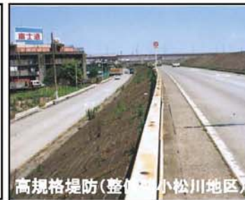
高規格堤防(整備前小松川地区)

■被害の最小化を図るため、既存施設の有効活用を含め、地域ごとに必要に応じた対策を実施します。 ■荒川下流部においては、堤防が決壊すると甚大な人的被害が発生する可能性が高い区間について高規格堤防の整備を行います。 ■なお、高規格堤防の整備にあたっては、まちづくり構想や都市計画との調整を行うことが必要であり、関係者との調整状況を踏まえつつ順次事業を実施します。