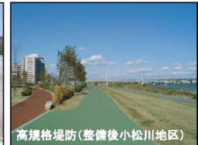
高規格堤防(整備後小松川地区)