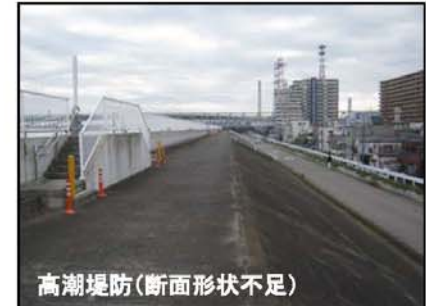
高潮堤防(断面形状不足)

■荒川の河口から堀切橋までの区間において、高潮堤防の断面形状に対して高さ又は幅が不足している区間について、嵩上げ又は拡幅を行います。