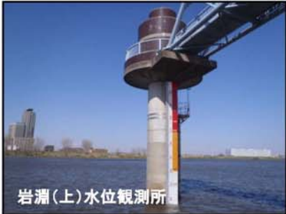
岩淵(上)水位観測所