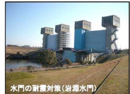
水門の耐震対策(岩淵水門)

■耐震性能の照査結果に基づき必要に応じて耐震・液状化対策を実施します。 ■さらに、人口・資産が集中するゼロメートル地帯を抱える堤防においては、その重要性に鑑み大規模地震に対して堤防の沈下を抑制するよう、対策を実施します。 ■津波が遡上する区間では、水門、樋門・樋管、堰等の遠隔操作化や自動化等を進めます。 ■関係地方公共団体が設定する津波浸水想定に対して、必要に応じて情報提供、技術的な支援等に努めます。