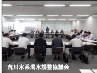
荒川水系渇水調整協議会