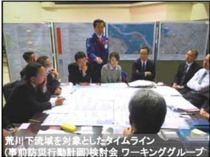
荒川下流域を対象としたタイムライン (事前防災行動計画)検討会 ワーキンググループ