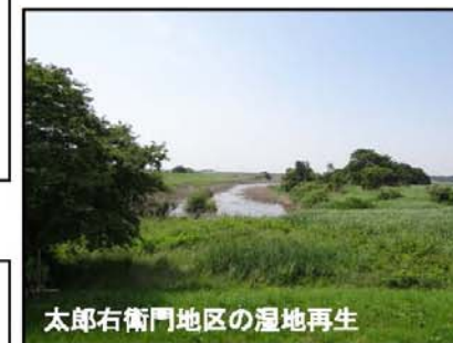
太郎右衛門地区の湿地再生