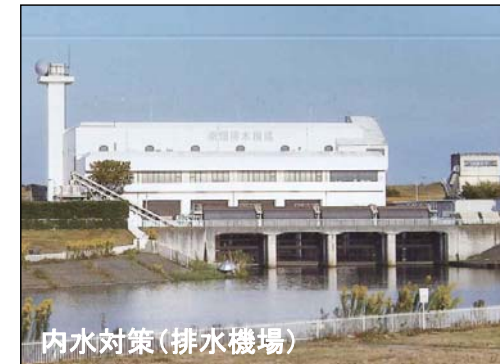
内水対策(排水機場)