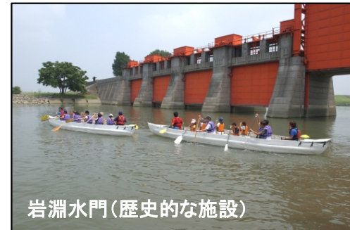
岩淵水門(歴史的な施設)