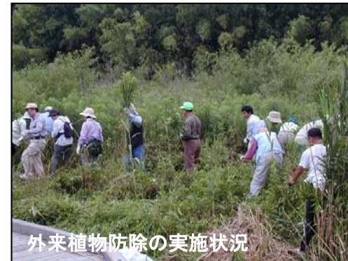
外来植物防除の実施状況