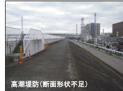
高潮堤防(断面形状不足)