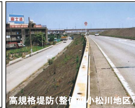
高規格堤防(整備前小松川地区)