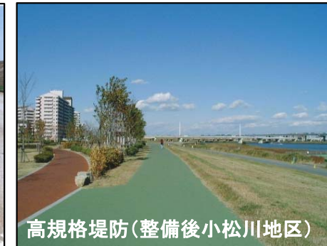
高規格堤防(整備後小松川地区)