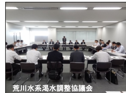
荒川水系渇水調整協議会