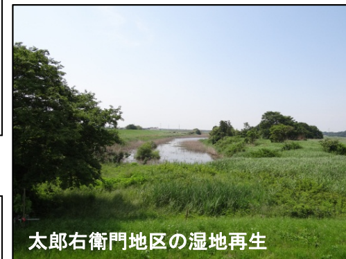
太郎右衛門地区の湿地再生