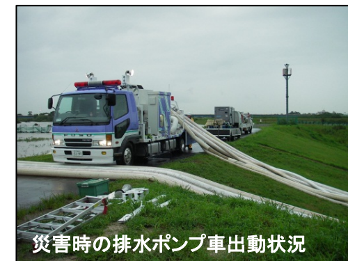
災害時の排水ポンプ車出動状況