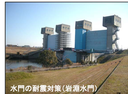
水門の耐震対策(岩淵水門)