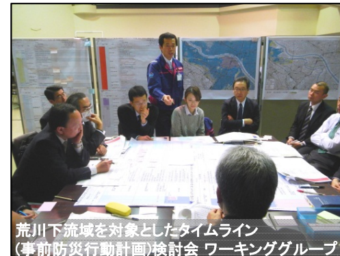
荒川下流域を対象としたタイムライン (事前防災行動計画)検討会 ワーキンググループ