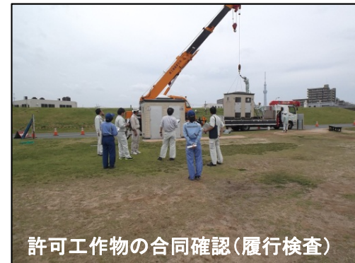
許可工作物の合同確認(履行検査)