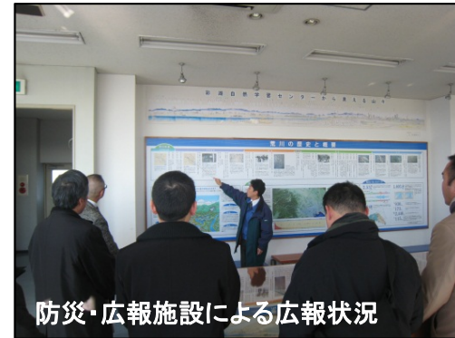
防災・広報施設による広報状況