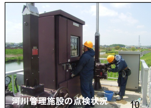
河川管理施設の点検状況