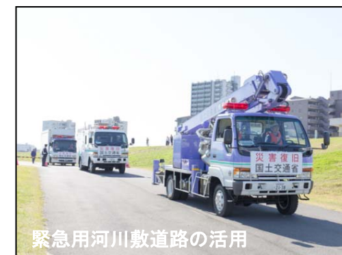
緊急用河川敷道路の活用