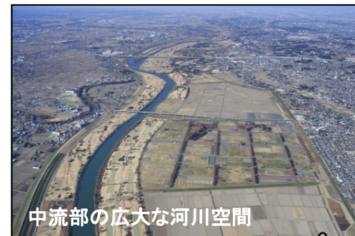
中流部の広大な河川空間