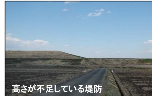
高さが不足している堤防